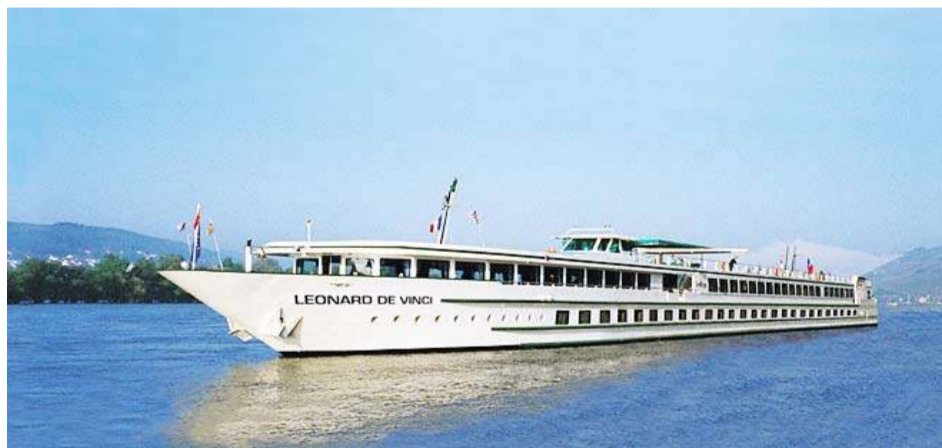
Para algunos, estos barcos pueden ser más cómodos que los trasatlánticos.

Navegar por el Guadalquivir a bordo del Belle de Cadix es la forma más novedosa y original de descubrir las ciudades con más arte de toda España y el Algarve portugués, además de ser una de las rutas más solicitadas.